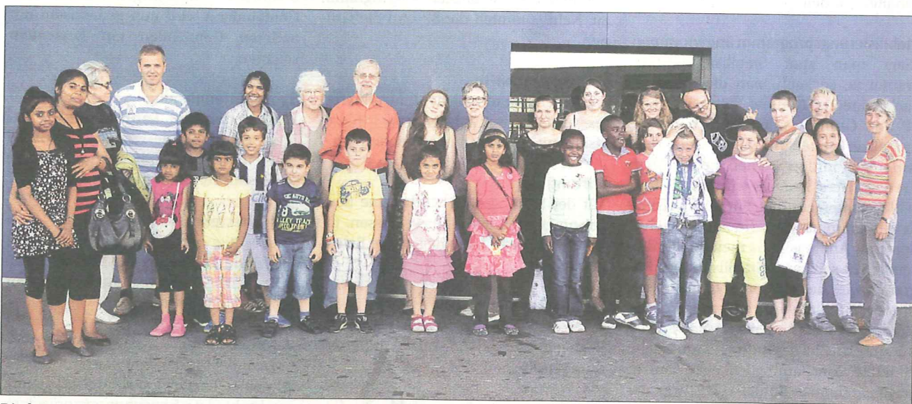
Die bunte MUNTERwegs-Truppe traf sich zum Abschied auf dem Vierwaldstättersee.

Verein MUNTERwegs; kontakt@munterwegs.eu; Rita Pasquale Telefon 041 260 28 60.